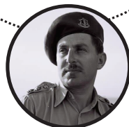
حییم هرزوک ششمین رئیس جمهور متولد ایرلند شمالی