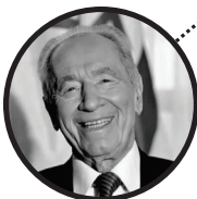
شیمون پرز نهمین رئیس جمهور متولد بلاروس