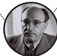
زالمان شاتزیر سومین رئیس جمهور متولد بلاروس