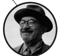
حییم وایزمن اولین رئیس جمهور متولد بلاروس